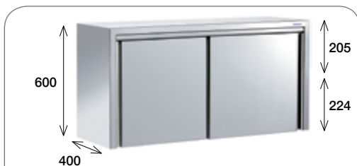
Armarios de pared puertas correderas

Construidos en acero inoxidable AISI 304 18/10 satinado. Estante intermedio regulable en altura. Facilidad de montaje a la pared. Sistema regulable de pared para desniveles de más de 1 cm.