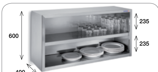
Armarios de pared abierto